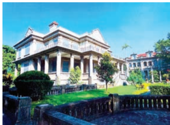
鼓浪嶼黃家花園中樓、北樓及花園一角。

20 世紀二三十年代，廈門的人每天的生活幾乎都與一個人有關：從喝水到用電，從打電話到買東西，從逛馬路到乘車或坐船進出島，乃至就醫、求學、住房等方方面面。不僅如此，廈門能成為福建省第一個建市的城市，也與他有關。僑批、鼓浪嶼和泉州的成功申報世界記憶名錄、世界文化遺產名錄，他也功不可沒。